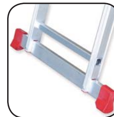
Detalle estabilizador Détail de stabilisation Detalhe estabilizador