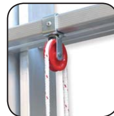
Detalle polea Détail poulie Detalhe da polia