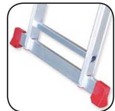
Detalle estabilizador Détail de stabilisation Detalhe estabilizador