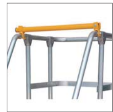
Barra de seguridad opcional Barre de sécurité en option Barra de segurança opcional