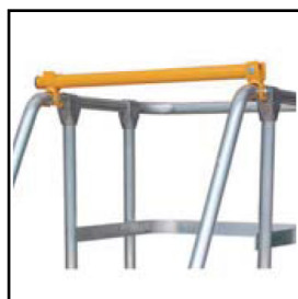
Barra de seguridad opcional